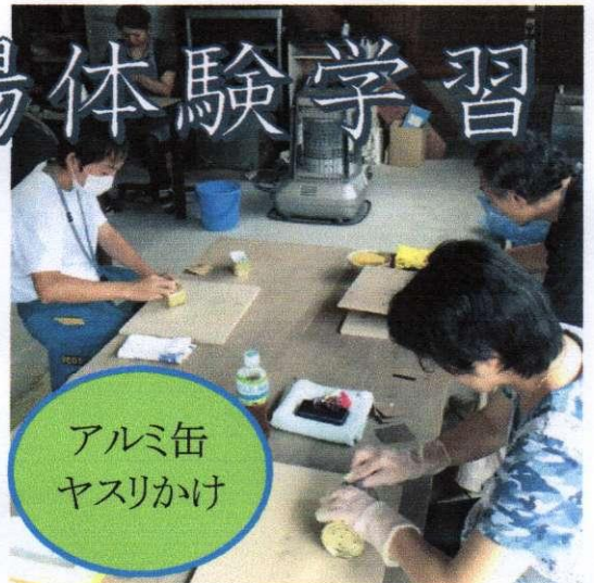
アルミ缶 ヤスリかけ