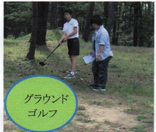
グラウンド ゴルフ