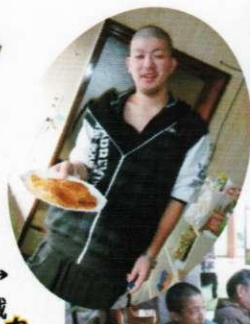
光晴君は→ ホットケーキに初挑戦

カ レ ー パ ー ティ → (わいかん特性 ビーフカレー) 作る人によつて 微妙に味が変 わりまします