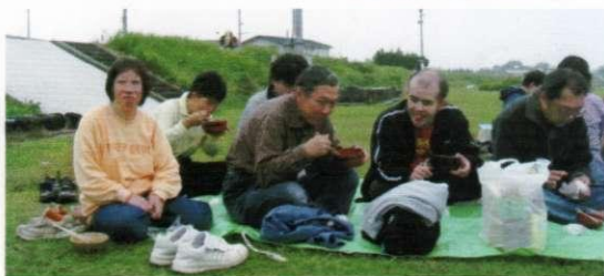
(楽しかった芋煮会)